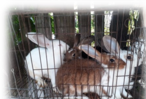
Producciones de los asociados.