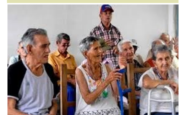
Adultos mayores compartiendo en una casa de abuelos.

Para la atención a la Tarea Victoria se destinó en el año 2 mil 344 pesos, las prestaciones monetarias para esta tarea oscilan entre los 217 pesos y 228